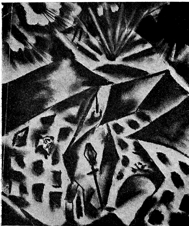
אין די יארצסלויער קאזארמעס